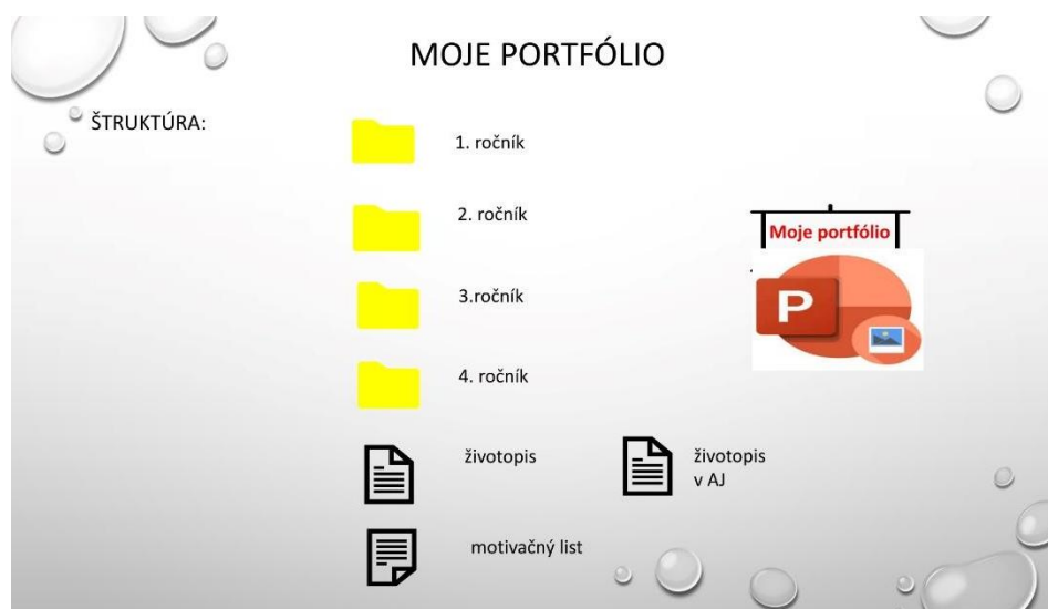
Obr 2 Štruktúra el. portfólia

Žiacke elektronické portfólio nie je žiadny štandardizovaný test. Jeho štruktúru sme racionálne navrhli na základe ročného delenia stredoškolského štúdia. Na EP žiak využíva úložisko OneDrive, kde má svoju zložku s názvom „Moje portfólio“. Tá obsahuje ďalšie zložky podľa ročníkov a iné wordovské dokumenty. Spravidla v štvrtom ročníku štúdia si žiak vytvára kariérové portfólio výberom vhodných položiek podľa záujmu ďalšieho štúdia. Takéto EP je vhodné použiť na prijímacích pohovoroch na vysokú školu, či uchádzaní sa o pracovné miesto.